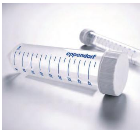
Конические пробирки на 15 и 50 мл