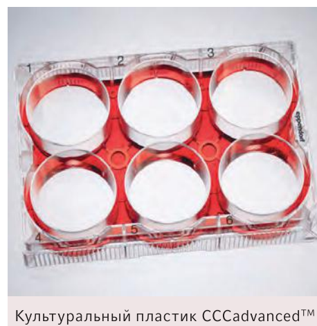
Культуральный пластик CCCadvanced™