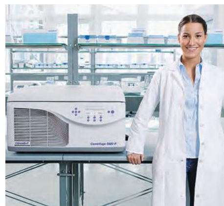
Центрифуга 5920 R