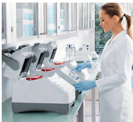
Амплификатор Mastercycler® X50

Узнайте больше о продукции Eppendorf на сайте: www.eppendorf.ru