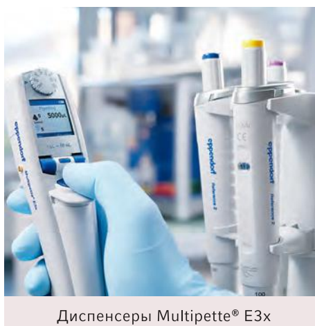
Диспенсеры Multipipette® E3x