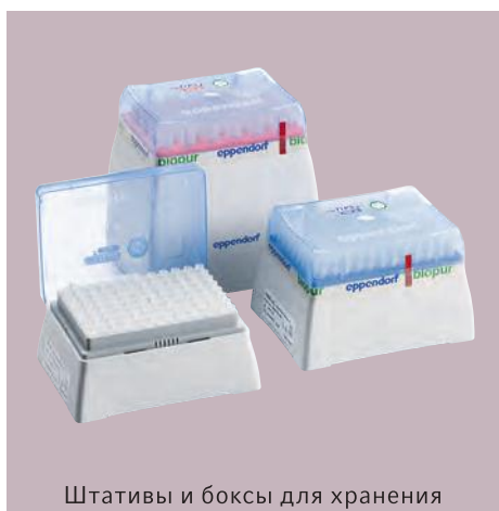
Штативы и боксы для хранения