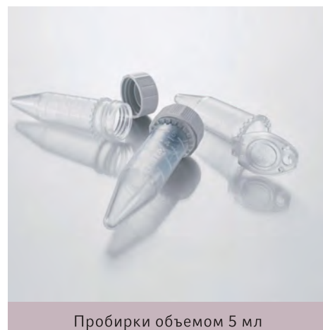
Пробирки объемом 5 мл