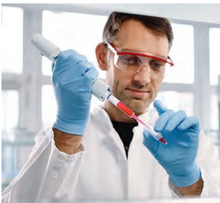
Наконечники Combitips advanced