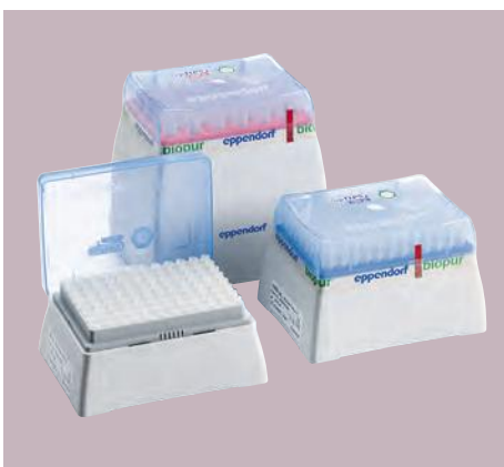
Штативы и боксы для наконечников