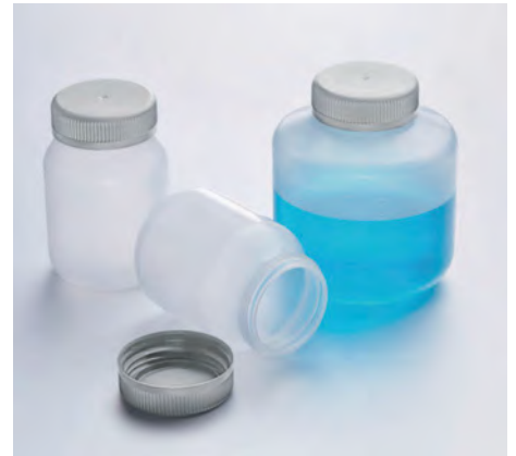
Флаконы объемом 400 мл и 1000 мл