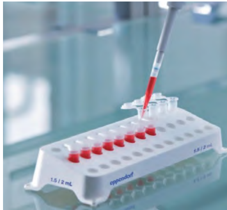
Штативы для пробирок