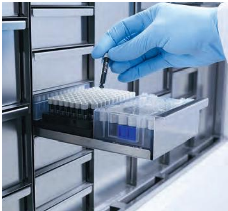
Криопробирки CryoStorage Vials