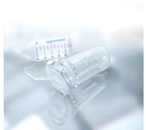
Пробирки объемом 25 мл