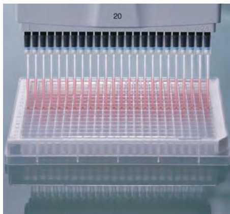
Дозирование в формате 384